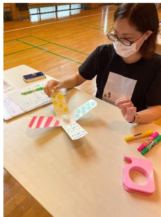
子どもの遊びと遊ばせ方