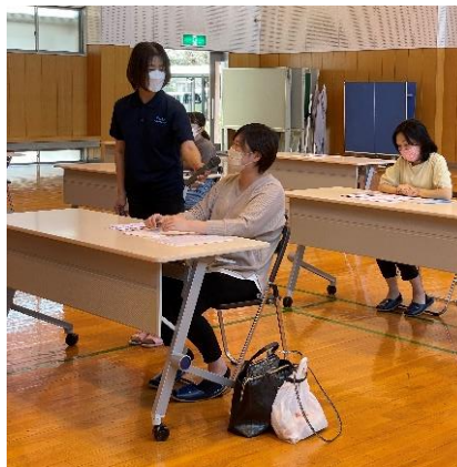
山鹿市子育ての現状