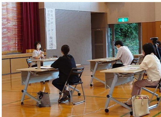
子どもの心身の発達と関わり