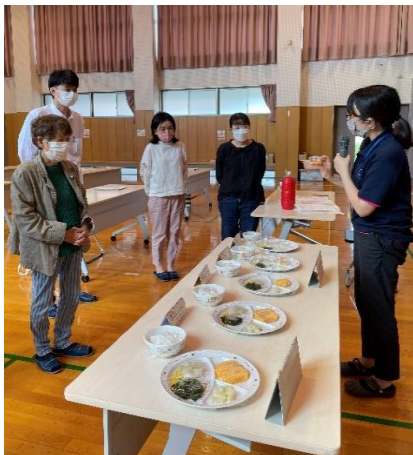
乳児期・幼児期の食事と食生活