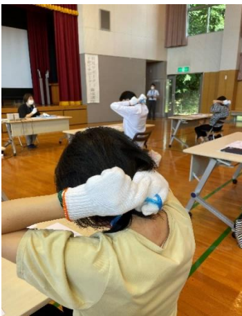
発達障害～理解と支援～