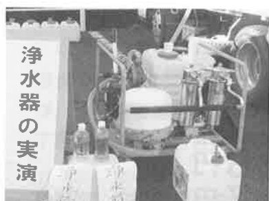
管工事業組合による浄水器の実演