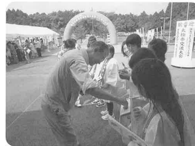
ねりんピック会場での街頭募金