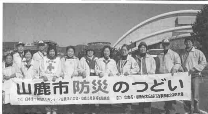
山鹿市防災のつどい

主催 日本赤十字防災ボランティア山鹿あいの会 協力 山鹿市 山鹿市社会福祉協議会