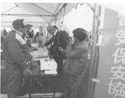
防災グッズの展示