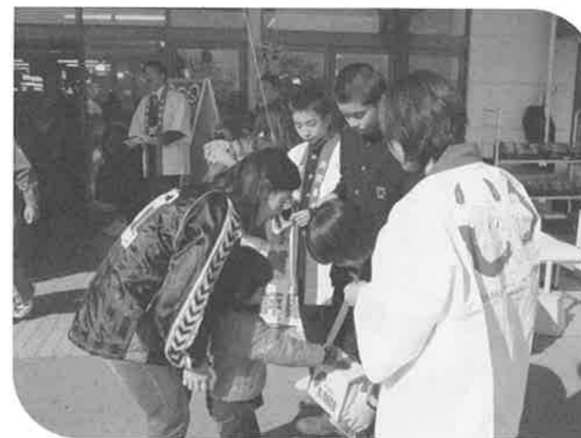
ゆめマートでの街頭募金