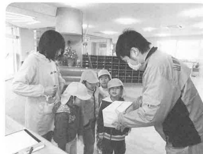
城北アソカ保育園と園児からの募金