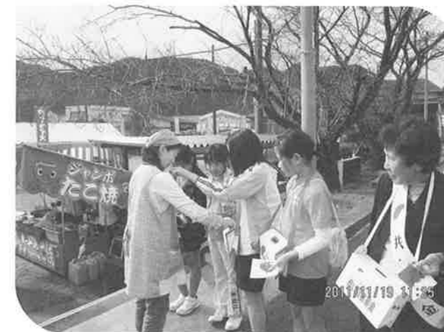
かほくまつりでの街頭募金