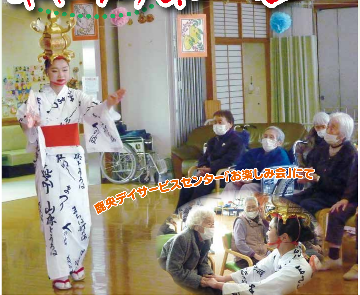
鹿央デイサービスセンター「お楽しみ会」にて

鹿央デイサービスセンターでは、コロナ禍で行事が少ない中、利用者様に楽しんでいただこうと『お楽しみ会』を開催しました。職員とその家族による「山鹿灯籠おどり」のサプライズ披露に、利用者様は終始笑顔であふれ、会場は歓声に包まれました。