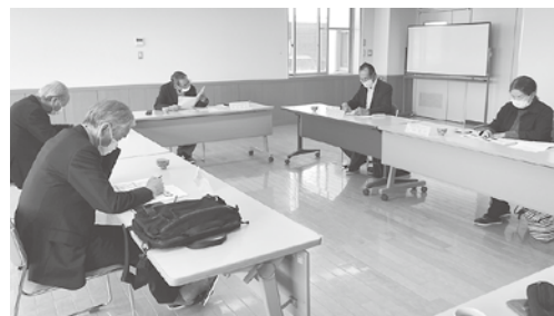
<審査委員会の様子>