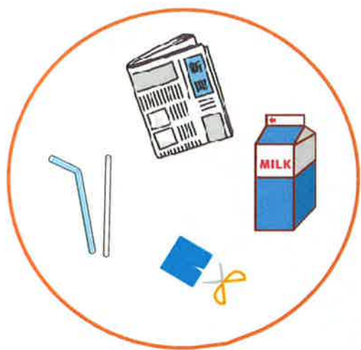
牛乳パックとんぼ

また、会員同士の交流を深めることができ、参加いただいたみなさん時間を忘れ、楽しんでいただけたようです。